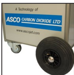
Fácil y cómoda maniobrabilidad