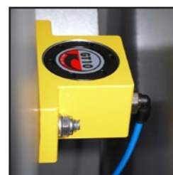
Óptimo flujo de pellets mediante un vibrador de aire sin mantenimiento