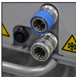
Sistema de manguera doble para un rendimiento máximo