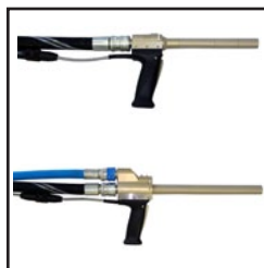
Opcionalmente sistema de manguera única o doble