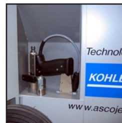
Caja lateral para la pistola, boquillas y herramientas