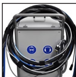
Colgador de manguera integrado